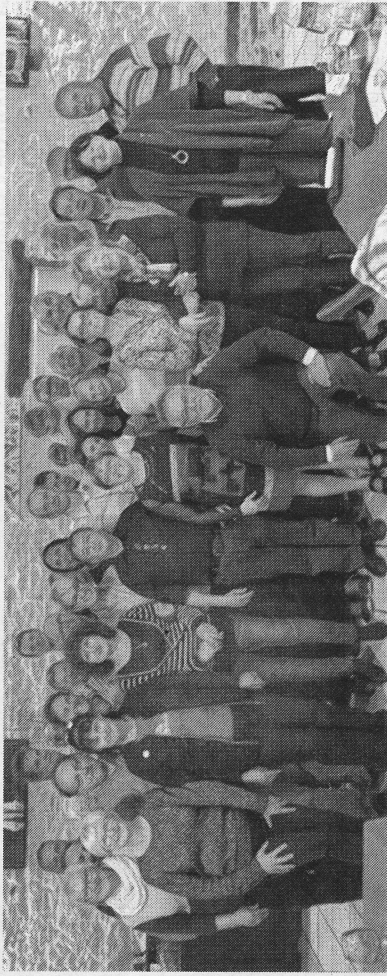
Quelques moments de convivialité et d'échanges en Français et Allemands.